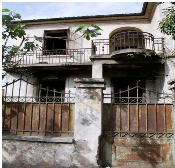
(Godina ku banonin transgjnjorët)

Fakti që komunitetit transgjnjor, as Bashkia e Tiranës dhe as Ministria e