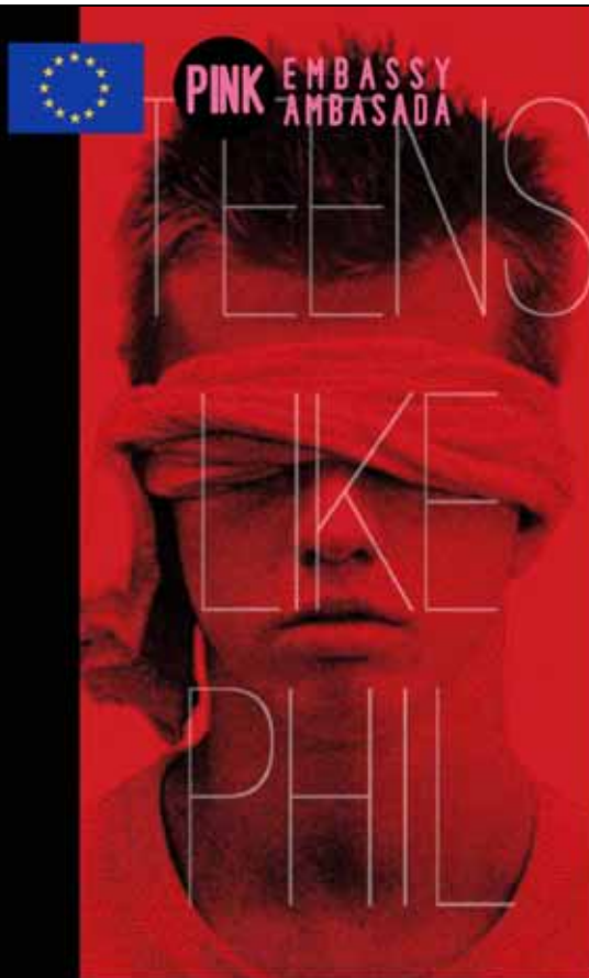
TEENS LIKE PHIL / 20 MIN

5 May Movie screening "Kids of Gay Parents speak out" and "Teens like Phil" will show moments from the lives and reality of LGBT parents. This will be followed by an open discussion. The event is being co-hosted by "La Blanche" in Elbasan.