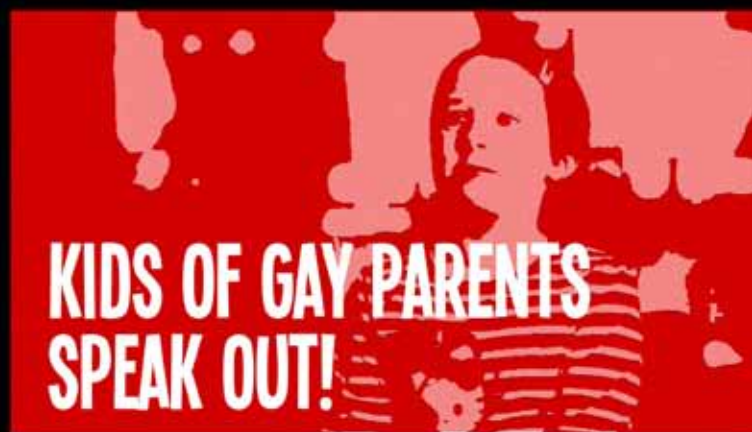
KIDS OF GAY PARENTS SPEAK OUT! / 3:48 MIN